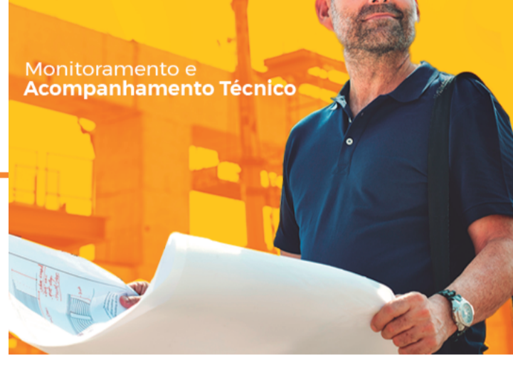
Monitoramento e Acompanhamento Técnico

■ Monitoramento e Acompanhamento Técnico