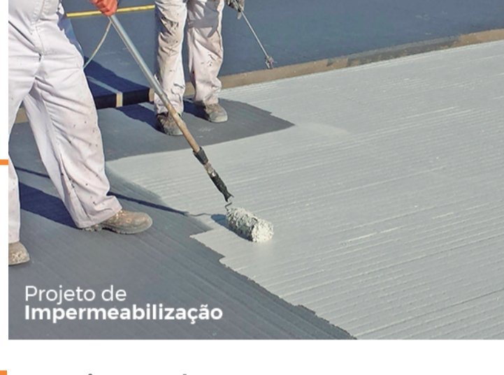
Projeto de Impermeabilização