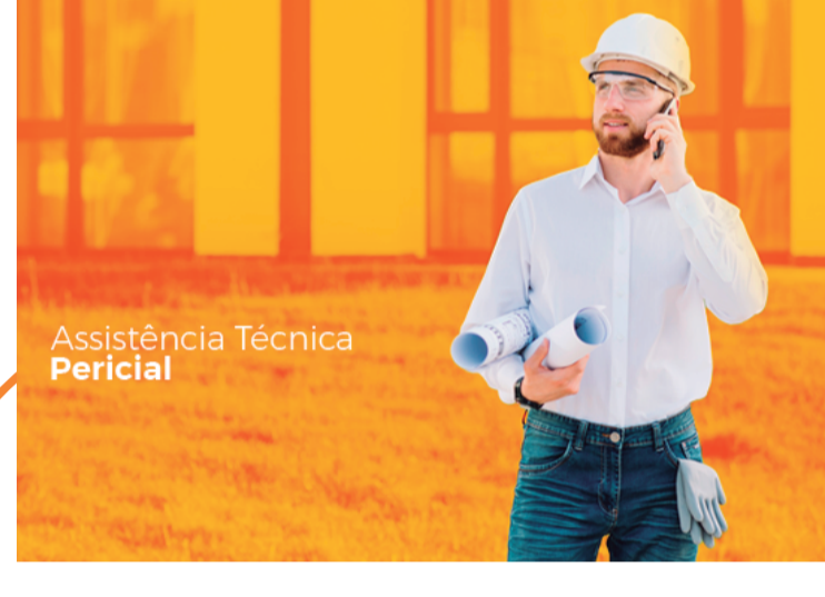
Assistência Técnica Pericial