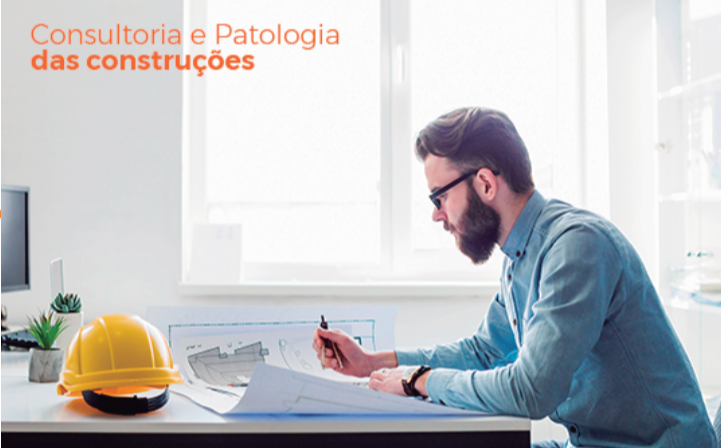
Consultoria e Patologia das construções