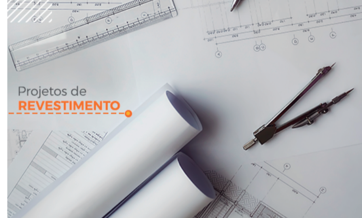
Projetos de REVESTIMENTO