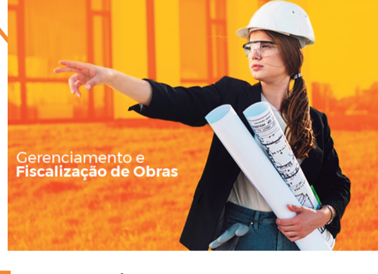
Gerenciamento e Fiscalização de Obras

■ Monitoramento e Acompanhamento Técnico